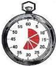
MODALIDAD CAMPO: 35 MINUTOS