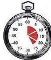
MODALIDAD PISTA: 25 MINUTOS